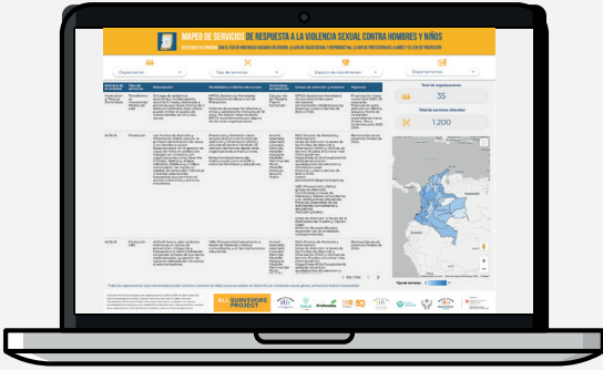
Directorio online o dashboard