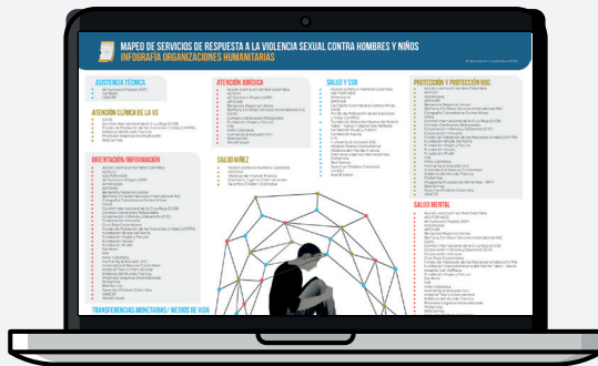
Infografía y Factsheet: descargable e imprimible