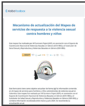
Enlace para formulario KOBO