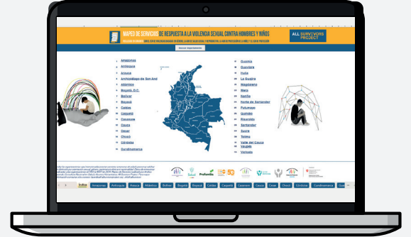
Directorio en Excel para descargar