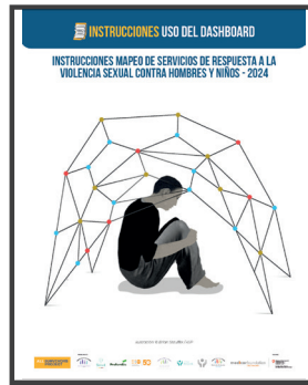
Documento con Instrucciones para la actualización del mapeo de servicios