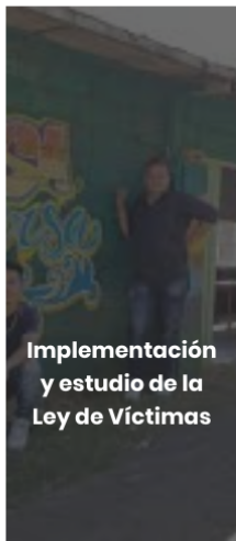
Implementación y estudio de la Ley de Víctimas

Caribe Afirmativo y Colombia Diversa hemos participado en mecanismos como: