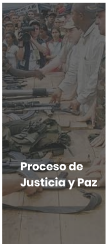
Proceso de Justicia y Paz