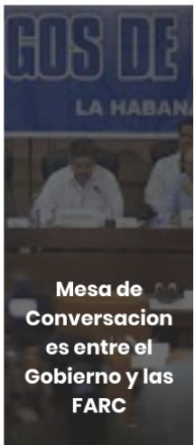
Mesa de Conversaciones entre el Gobierno y las FARC