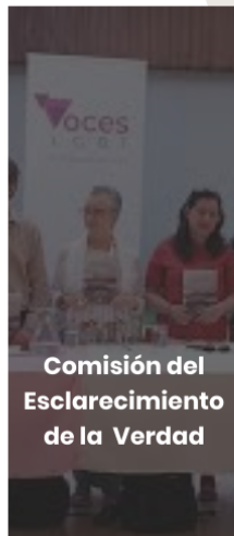
Comisión del Esclarecimiento de la Verdad

Desde Caribe Afirmativo, Colombia Diversa y All Survivors Project buscamos visibilizar la violencia sexual como forma de violencia por prejuicio contra personas LGBT en el conflicto armado, los graves crímenes que constituyen dichos actos y la importancia de entender que la discriminación ha sido el combustible detrás de estas atroces violaciones de derechos humanos.